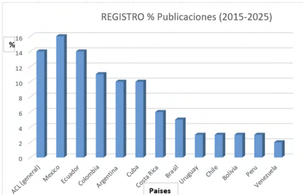
GRAFICO 1: Publicaciones

Según el periodo de estudio de 10 años de las 69 publicaciones preseleccionadas observamos que 72% de las publicaciones son más recientes (del 2017 al 2025) y 29 % pertenecen a los años 2009 al 2016, un artículo del 2009. Se comprueba que se ha incrementado la investigación ampliamente a partir del 2017, lo cual es importante para el tema en estudio.